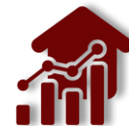
REAL ESTATE CAPITAL Consulting & Finance