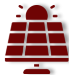
PHOTOVOLTAIK CAPITAL Consulting & Finance